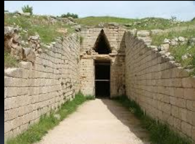
Θολωτός τάφος Ατρέα