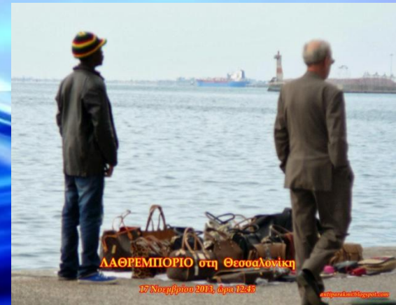
ΛΑΘΡΕΜΠΟΡΙΟ στη Θεσσαλονίκη